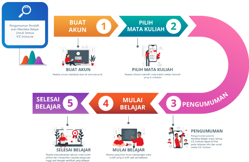
Gambar 7 Alur Pendaftaran (Umum)

Adapun alur pendaftaran Beasiswa MBUS baik untuk masyarakat umum adalah sebagai berikut.