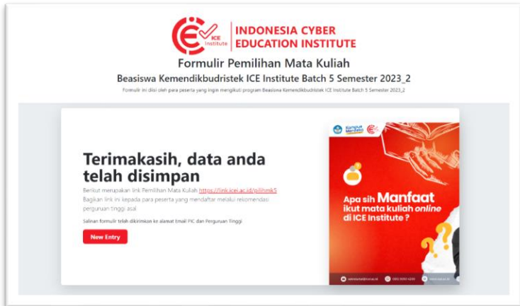
Gambar 4 Tampilan Setelah Selesai Upload Dokumen Oleh PT

rekomendasi dan pakta integritas. Setelah meng-klik submit , maka akan tampil seperti gambar 4 berikut yang berarti PT telah berhasil mendaftarkan perguruan tingginya.