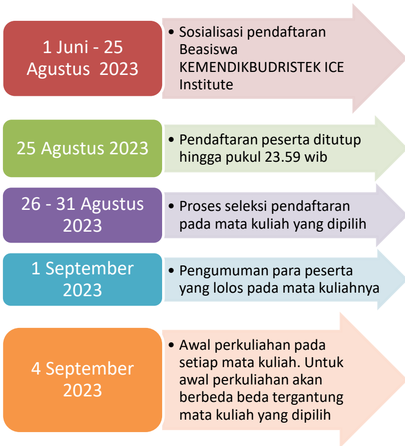
Gambar 1. Jadwal Pendaftaran