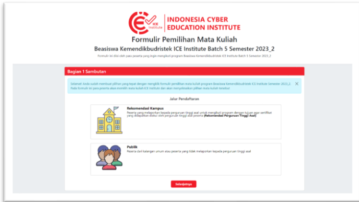
Gambar 9 Tampilan Form Pemilihan Mata Kuliah

Peserta memilih mata kuliah melalui link berikut https://link.icei.ac.id/pilihmk5